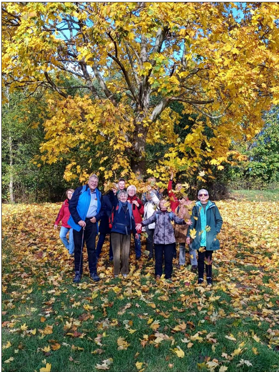
Von Albrechtshof zur Havel (07.11.2023)