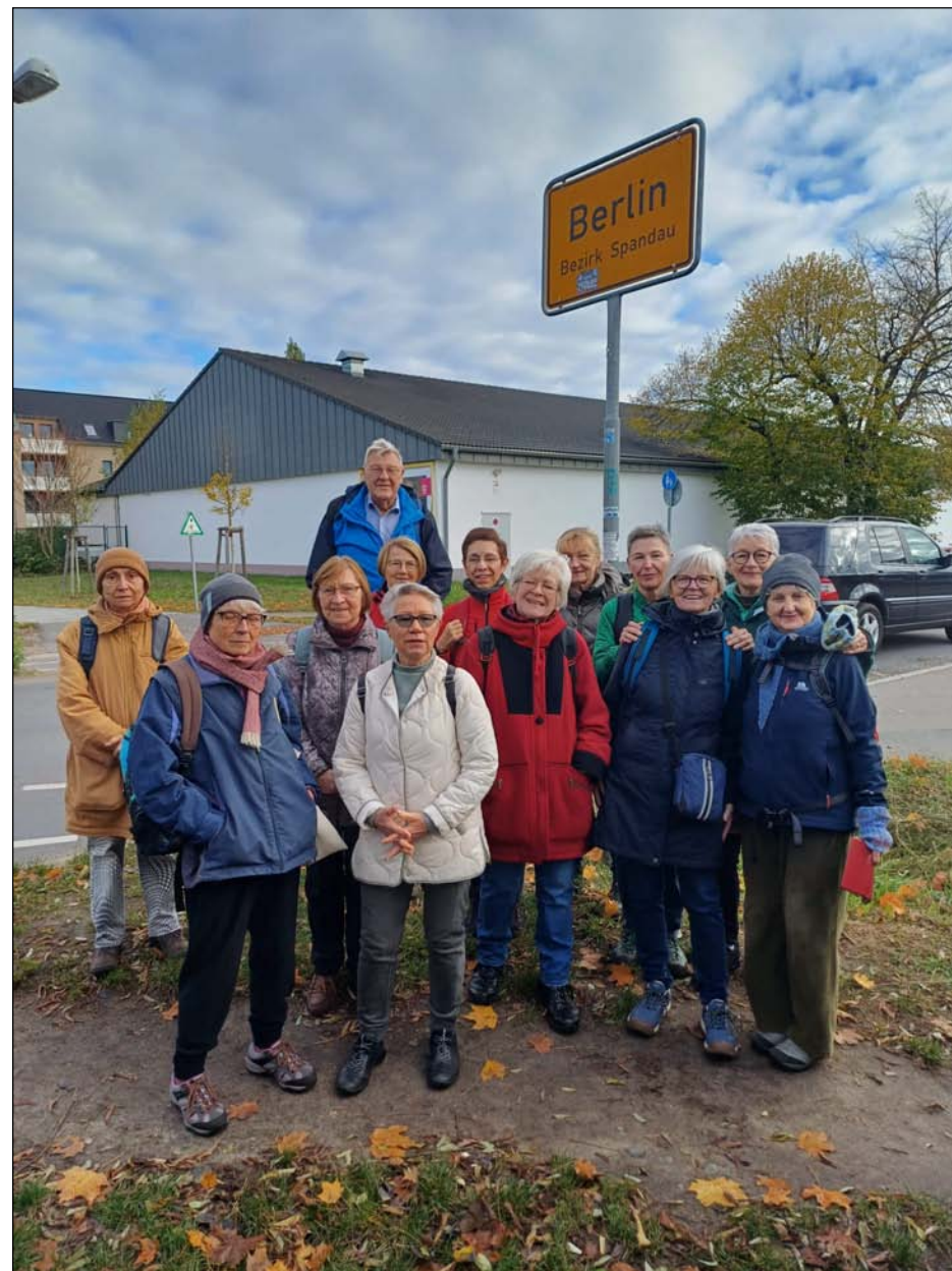
Von Albrechtshof zur Havel (07.11.2023)