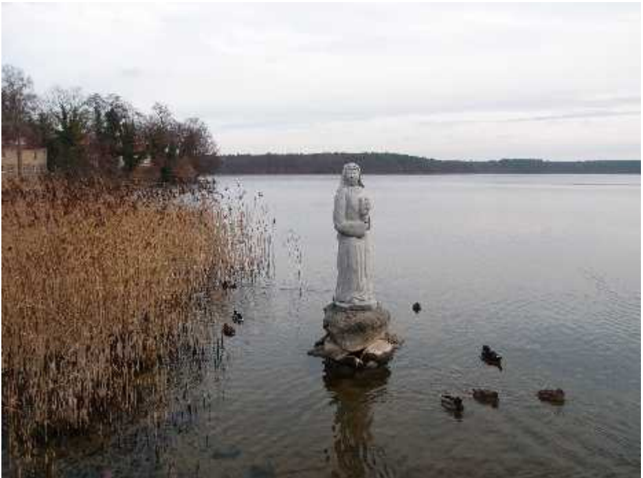
Klosterruine Lindow, Wutzsee (Adventsfahrt am 03.12.2011)